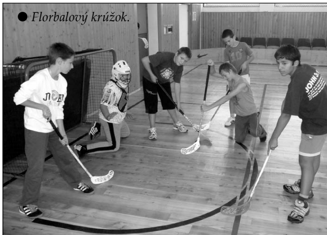
● Florbalový krúžok.