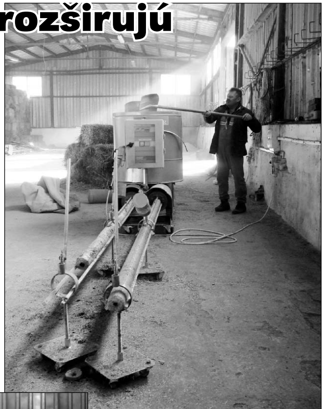
● Briketovací stroj.

absolvovali zaškolenie na prácu s pásovou pílou a momentálne píla funguje v skúšobnej prevádzke.