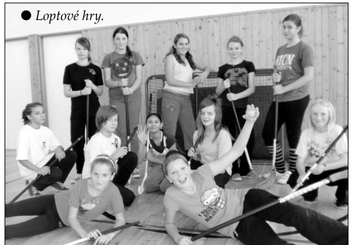
● Loptové hry.

Počujeme to z každej strany a čoraz častejšie: deti stále sedia len za počítačom, majú málo pohybu. V základnej škole vo Východnej sa proti tomuto „modernému fenoménu“ snažia bojovať aj bohatou ponukou krúžkov. V tomto školskom roku ich v škole funguje 14, z toho 5 so športovým zameraním – bežecké lyžovanie, stolný tenis, florbal, loptové hry, športové hry. Florbal a loptové hry navštevuje po 19 detí, lyžiarov, stolných tenistov a hráčov športových hier je po 14.