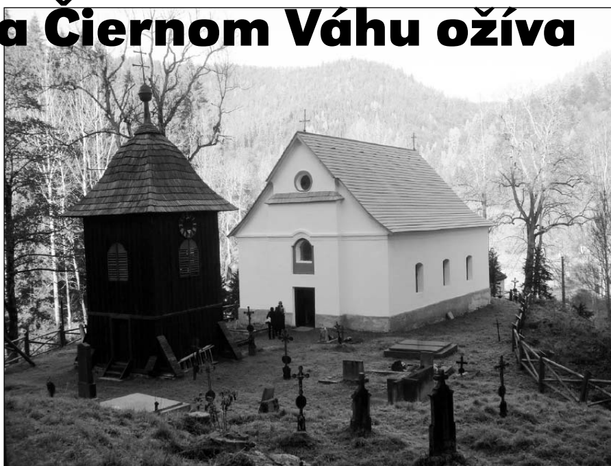
● Obnovený kostolík a vzácna drevená zvonica.

Slávnosť sa začala o 10.00 hod. Ľudia zaplnili celý kostol. Obidve strany lavíc