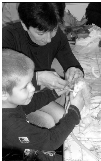
● Takto vznikala bábika Šúpolienka.

Jeseň so svojimi farbami a plodmi ponúka veľa príležitostí na rozvíjanie fantázie a tvorivosti u detí. Túto príležitosť využívame takmer každý deň, ale takúto možnosť sme ponúkli aj rodičom. Tvorivé dielne pre rodičov a ich deti s názvom