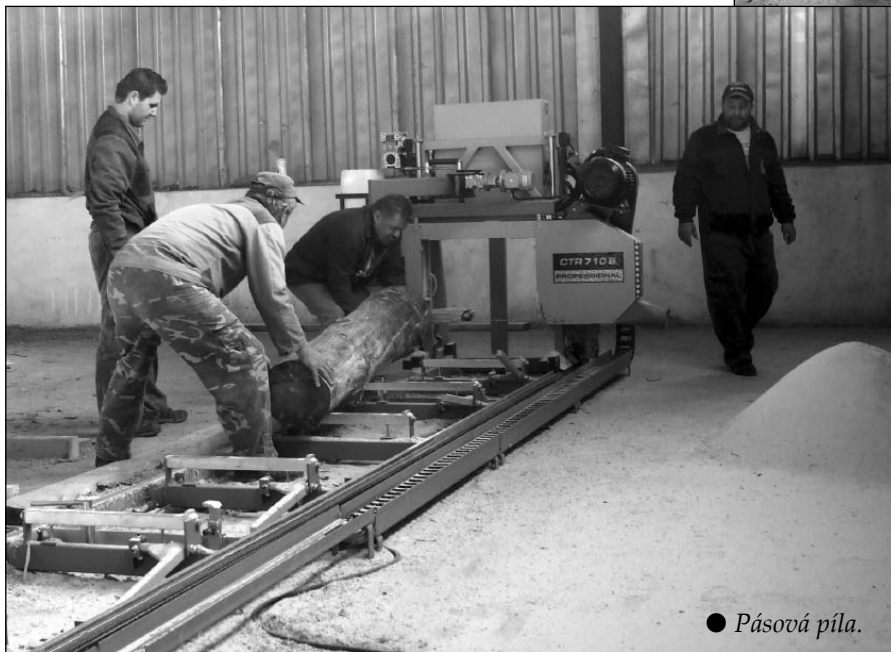
● Pásová píla.