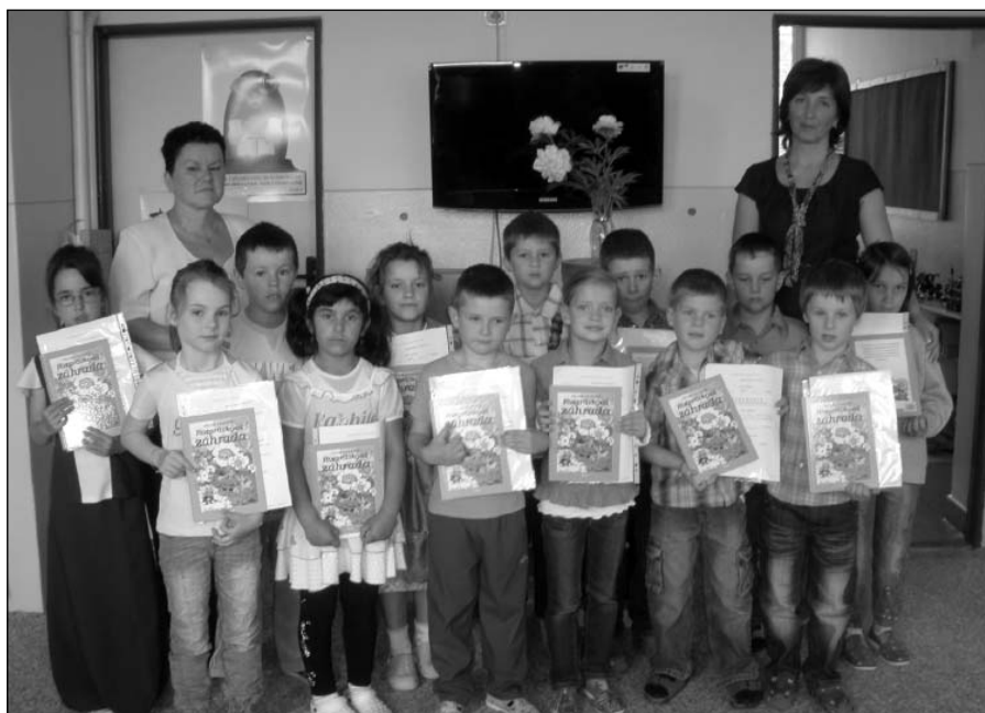
● Budúci prváci sa už rozlúčili so škôlkou.