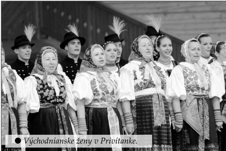
● Východnianske ženy v Privítanke.