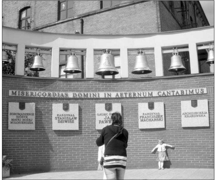
● Zvony v areáli Sanktuária Krakow – Lagiewniki, ktoré podarovali významní cirkevní hodnostári