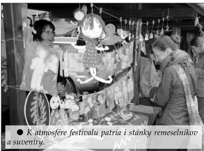
● K atmosfére festivalu patria i stánky remeselníkov a suveníry.