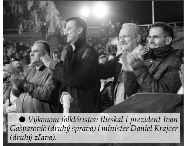
● Výkonom folklóristov tleskal i prezident Ivan Gašparovič (druhý sprava) i minister Daniel Krajcer (druhý zľava).