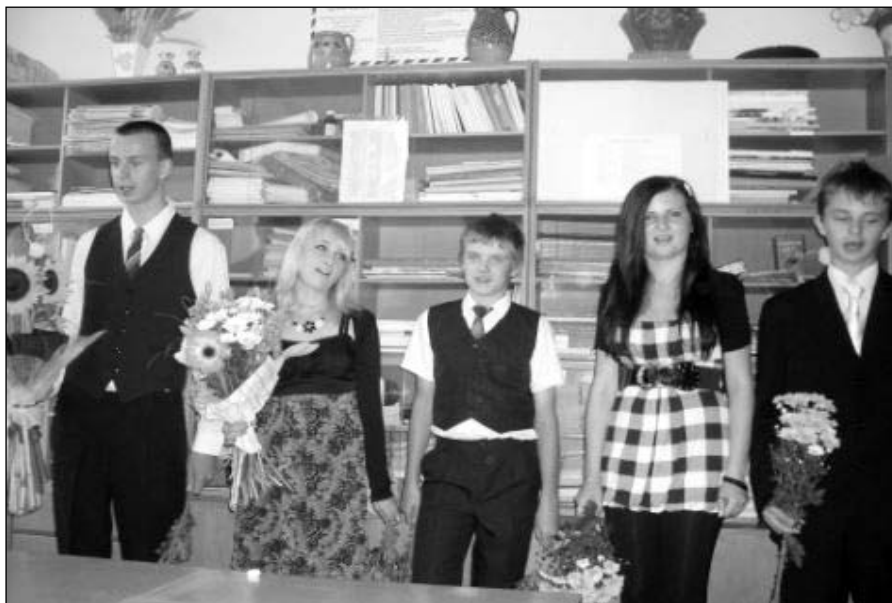
● Deviataci v zborovni zaspievali učiteľom rozlúčkovú pieseň.

Najdojemnejší koniec školského roka zažili tohtoroční deviataci, ktorí sa v júni nelúčili so základnou školou len na dva prázdninové mesiace, ale