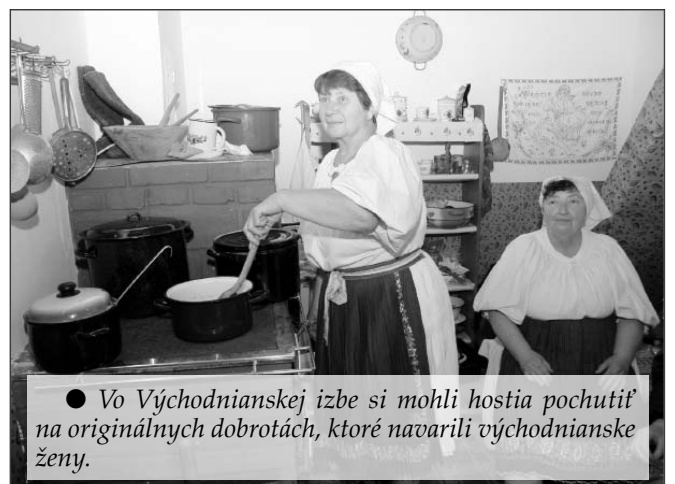
● Vo Východnianskej izbe si mohli hostia pochutiť na originálnych dobrotách, ktoré navarili východnianske ženy.