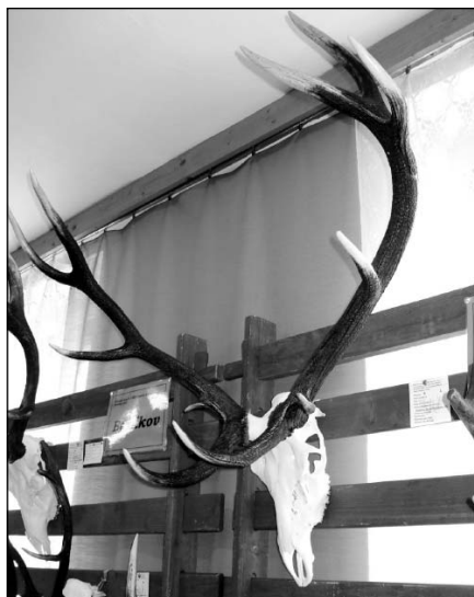
● „Strieborný“ jelen J. Halahiju.